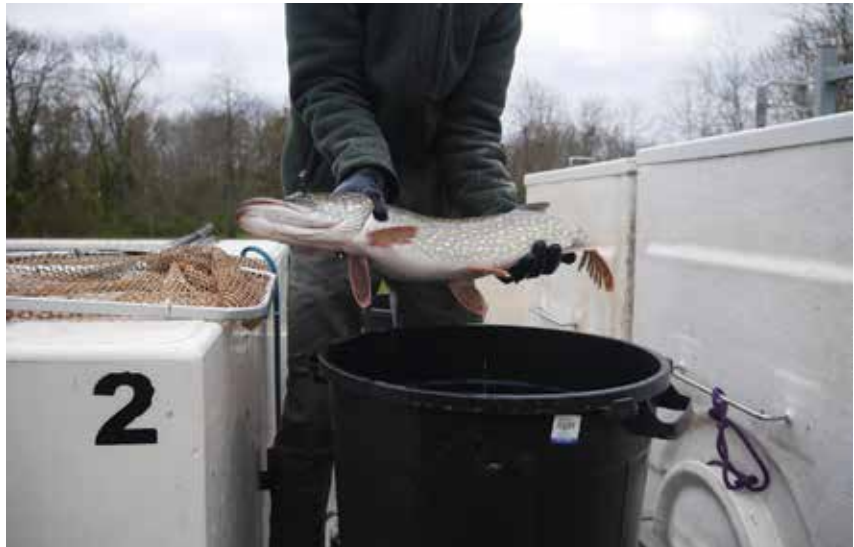
Un empoissonnement vient d'être effectué en brochets, sandres et perches

Fin 2020, début 2021, nous nous sommes donnés la priorité de dévégétaliser le banc de sable entre le plan d'eau et la Seine, pour un bon écoulement des eaux de manière manuelle sur ce site. La même chose a été effectuée au niveau de la plage du « Lido » mais cette fois de manière mécanique puisque les lieux se prêtaient à l'utilisation d'une grue. Coût 900 euros. Toutes les autorisations nous ont été accordées avec des recommandations, par les services de la DDT. Tous les membres du CA ont travaillé durement autour du plan d'eau pour dégager les espaces ouverts en retirant