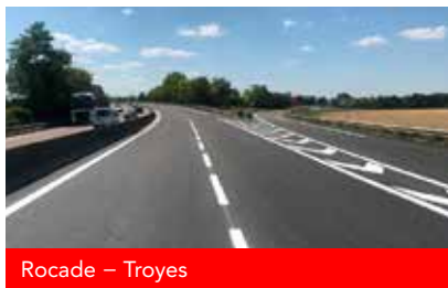
Rocade – Troyes