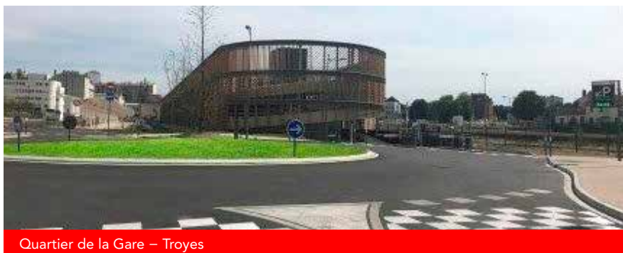
Quartier de la Gare – Troyes