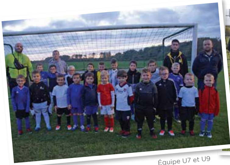
Équipe U7 et U9