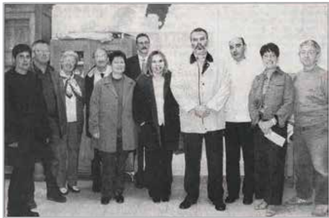
Le bureau du BAJ en 2004