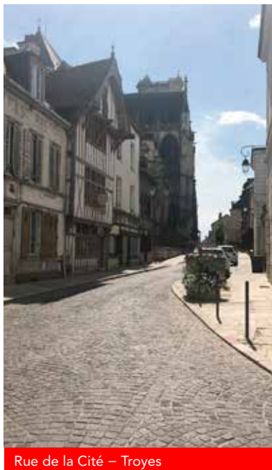
Rue de la Cité – Troyes